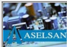
Aselsan büyük oynuyor